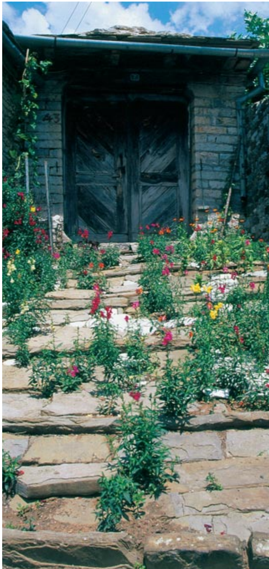
Παλιό σπίτι στο Πάπιγκο