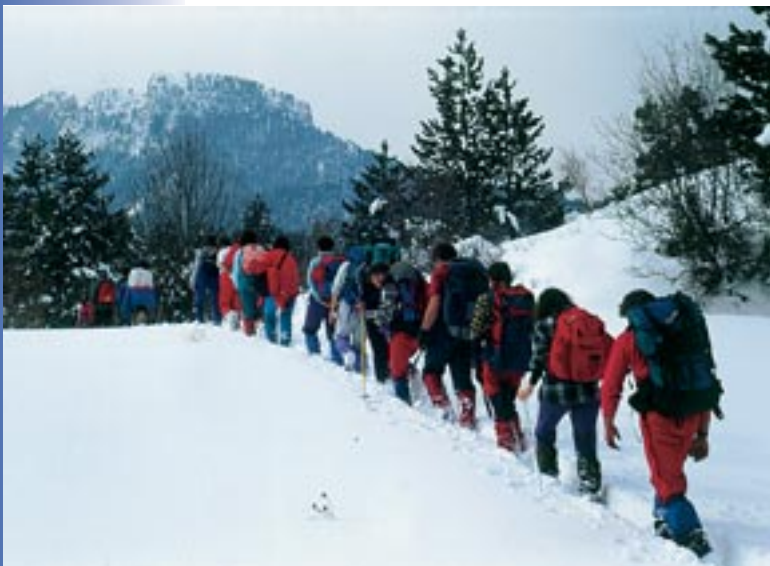
Χειμερινή ανάβαση στα Πιέρια, Φωτ. Κώστας Παρμενόπουλος

παροχής τουριστικών υπηρεσιών είναι η επίτευξη κέρδους.