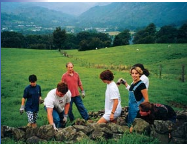
Υλοποίηση περιβαλλοντικών δραστηριοτήτων στο ιδιαίτερα τουριστικά ανεπτυγμένο εθνικό πάρκο Lake District της Αγγλίας.

3 Η συμμετοχή στο έργο "Ολοκληρωμένη Διαχείριση Ευρωπαϊκών Υγροτόπων". Σκοπός του έργου είναι να δώσει τεκμηριωμένες απαντήσεις σε ερωτήματα που σχετίζονται με το "πώς η κοινωνικοοικονομική ανάπτυξη μπορεί να συνδυασθεί με τη διατήρηση της βιοποικιλότητας σε τέσσερις αντιπροσωπευτικούς ευρωπαϊκούς υγροτόπους". Στην Ελλάδα το έργο υλοποιείται στην περιοχή της Λίμνης Κερκίνης. Το έργο θα συνδέσει θέματα διαμόρφωσης αντιλήψεων της τοπικής κοινωνίας για το φυσικό περιβάλλον με τις οικονομικές δραστηριότητες της περιοχής, την παρεχόμενη σχολική εκπαίδευση, τις δομές διαχείρισης και τις τουριστικές δραστηριότητες. Σκοπός των δράσεων που αφορούν τον τουρισμό είναι η καταγραφή της υπάρχουσας τουριστικής δραστηριότητας στην περιοχή της Κερκίνης και η διερεύνηση των δυνατοτήτων ανάπτυξης δράσεων αειφορικού τουρισμού. Το έργο εντάσσεται στο πρόγραμμα "Περιβάλλον, Ενέργεια και Αειφόρος Ανάπτυξη" του 5ου Προγράμματος Πλαισίου Έρευνας και Τεχνολογικής Ανάπτυξης της Ευρωπαϊκής Επιτροπής.