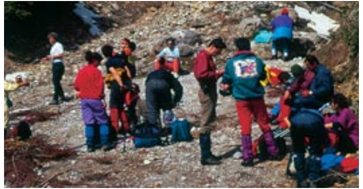
Πιέρια Όρη

Η σπουδαιότητα που έχει η συμμετοχή όσο το δυνατόν περισσότερων κοινωνικών ομάδων στη διαχείριση του φυσικού περιβάλλοντος, αναγνωρίζεται όλο και περισσότερο τόσο σε εθνικό όσο και σε διεθνές επίπεδο. Η αναγνώριση αυτή έχει οδηγήσει στην ανάπτυξη μιας προσέγγισης, σκοπός της οποίας είναι, δημόσιες υπηρεσίες, ερευνητικά ιδρύματα, χρήστες φυσικών πόρων, περιβαλλοντικές οργανώσεις και άλλοι ενδιαφερόμενοι, να μοιράζονται την ευθύνη διαχείρισης προστατευόμενων περιοχών ή φυσικών πόρων. Η δυνατότητα εφαρμογής της προαναφερθείσας προσέγγισης ερευνάται με τη βοήθεια των μεθόδων του Συμμετοχικού Σχεδιασμού και της Συμμετοχικής Εκτίμησης, Παρακολούθησης και Αξιολόγησης της διαχείρισης του φυσικού περιβάλλοντος (Participatory Planning; Participatory Appraisal, Monitoring and Evaluation). Οι μέθοδοι αυτές άρχισαν να εφαρμόζονται τα τελευταία 50 έτη για την επίλυση προβλημάτων επιχειρήσεων, όπως η εισαγωγή νέων προϊόντων σε αγορές.