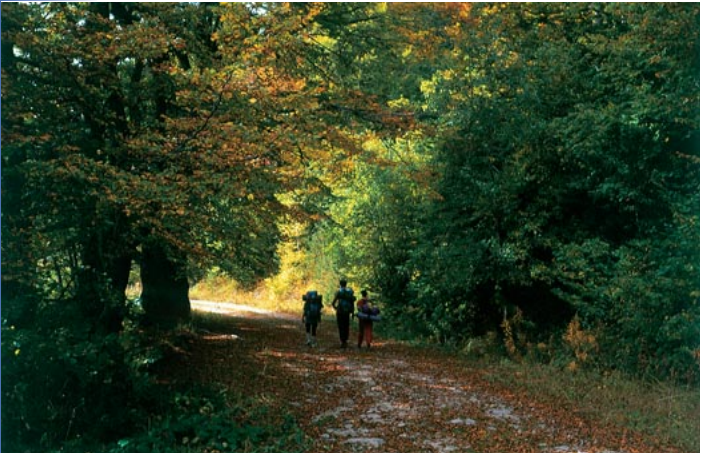
Δασικός δρόμος στη Ροδόπη