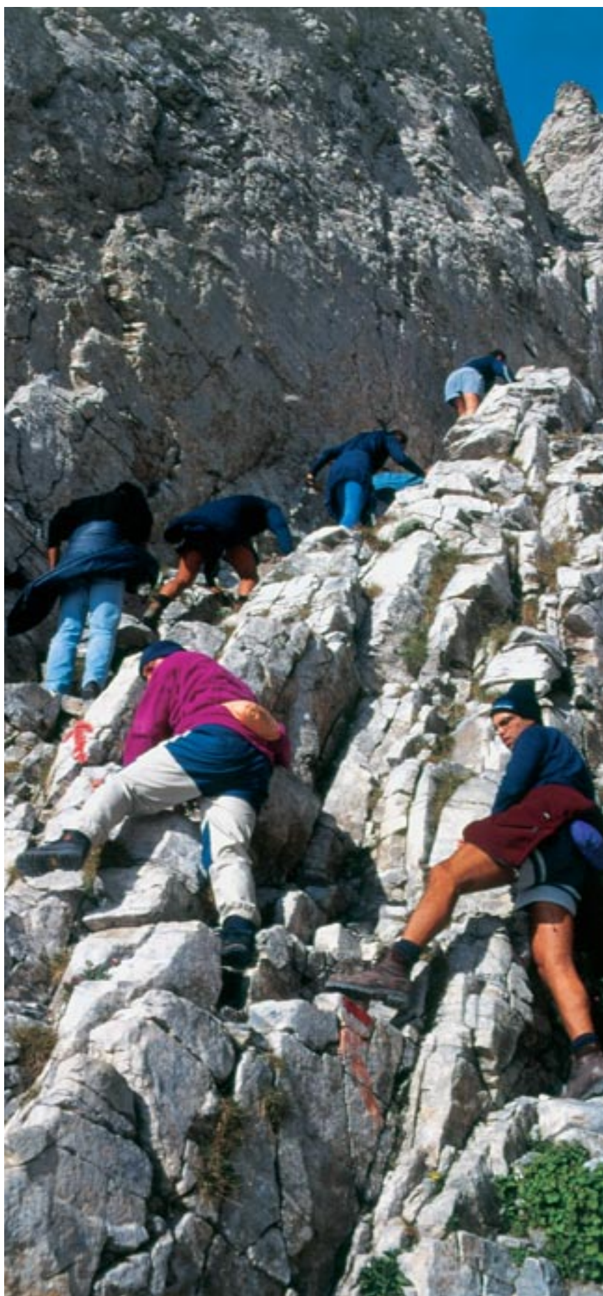
Ο Όλυμπος προσελκύει ετησίως μεγάλους αριθμούς τουριστών, Φωτ. Κώστας Παρμενόπουλος