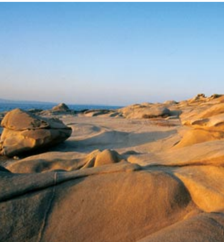
Παραλία στη Βουρβουρού Χαλκιδικής

Την τελευταία πενταετία καταβάλλεται προσπάθεια να ερευνηθεί η καταλληλότητα των μεθόδων συμμετοχικού σχεδιασμού στη διαχείριση του φυσικού περιβάλλοντος. Η προσπάθεια αυτή υποστηρίζεται τόσο από ερευνητικά ιδρύματα, όσο και από διεθνή θεσμικά όργανα. Για παράδειγμα, η Ευρωπαϊκή Επιτροπή, αναγνωρίζει τον συμμετοχικό σχεδιασμό ως μία από τις αρχές ορθής διαχείρισης της παράκτιας ζώνης. Τα εργαλεία συμμετοχικής έρευνας περιλαμβάνουν την αναγνώριση και την ανάλυση ενδιαφερομένων ομάδων (stakeholder identification and analysis), τις ομάδες εστίασης (focus groups), την προσαρμόσιμη διαχείριση (adaptive management) κ.λπ. Η έρευνα προς την κατεύθυνση αυτή μπορεί να συμβάλλει ουσιαστικά στον ολοκληρωμένο και αποδοτικό σχεδιασμό ανάπτυξης τουριστικών δραστηριοτήτων σε προστατευόμενες περιοχές.