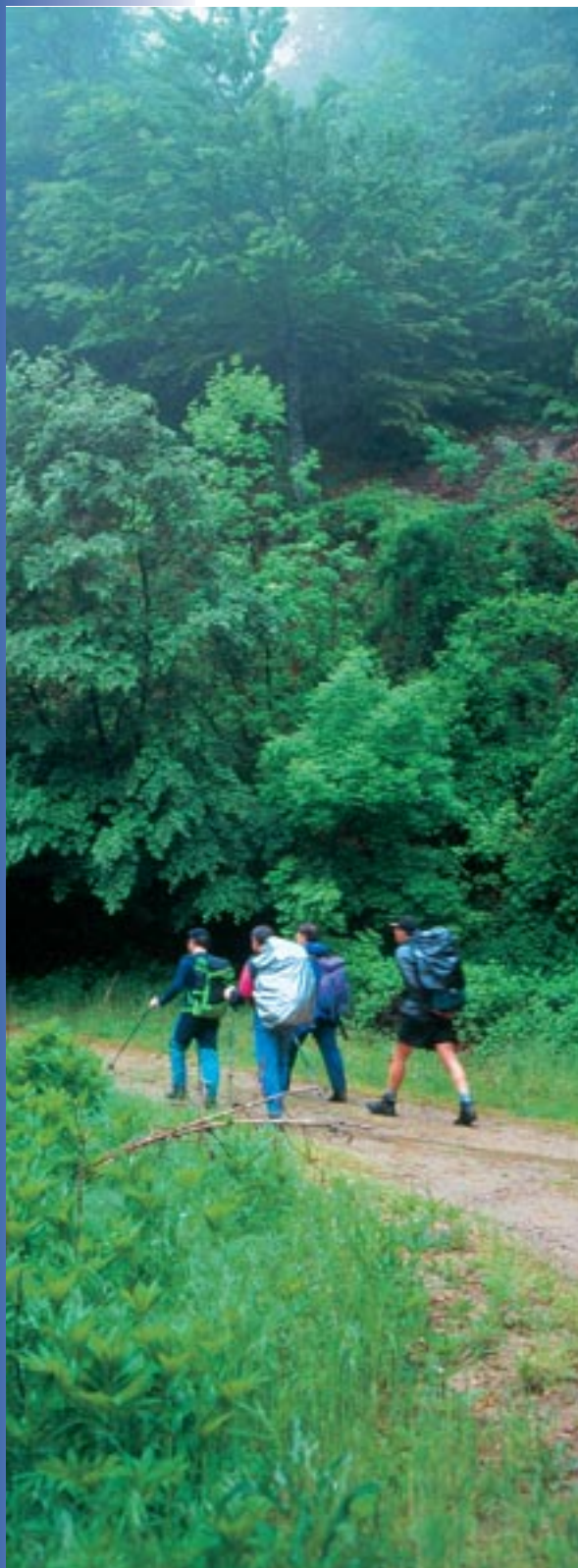
Όρος Μπέλες, Φωτ. Κώστας Παρμενόπουλος

Οι οικοτουριστικές δραστηριότητες γνωρίζουν, τις τελευταίες δύο δεκαετίες, μεγάλη ανάπτυξη η οποία αναμένεται να ενταθεί στο άμεσο μέλλον. Αναγνωρίζοντας την παγκόσμια σημασία του οικοτουρισμού, ο Οργανισμός Ηνωμένων Εθνών, ανακήρυξε το έτος 2002 ως Διεθνές Έτος Οικοτουρισμού.