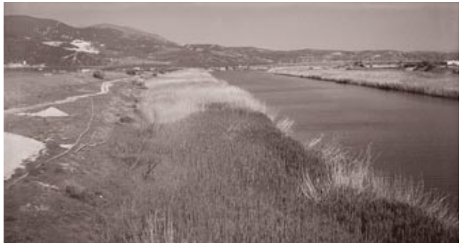
Καλαμώνες στην όχθη του Στρυμόνα, Φωτ. Αρχείο ΕΚΒΥ / Μ. Δαβής

Το ΕΚΒΥ και η Διεύθυνση Εγγείων Βελτιώσεων της Νομαρχιακής Αυτοδιοίκησης Σερρών (ΔΕΒ Σερρών), διοργάνωσαν τον Φεβρουάριο ημερίδα με τίτλο «Συμβολή στην αειφορική διαχείριση των υδάτων του Στρυμόνα».