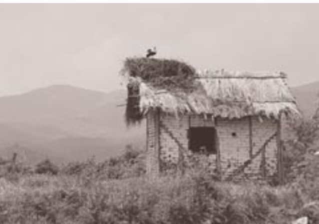
Λίμνη Κερκίνη