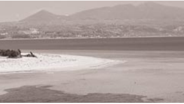
Λιμνοθάλασσα Γιάλοβα της Πύλου