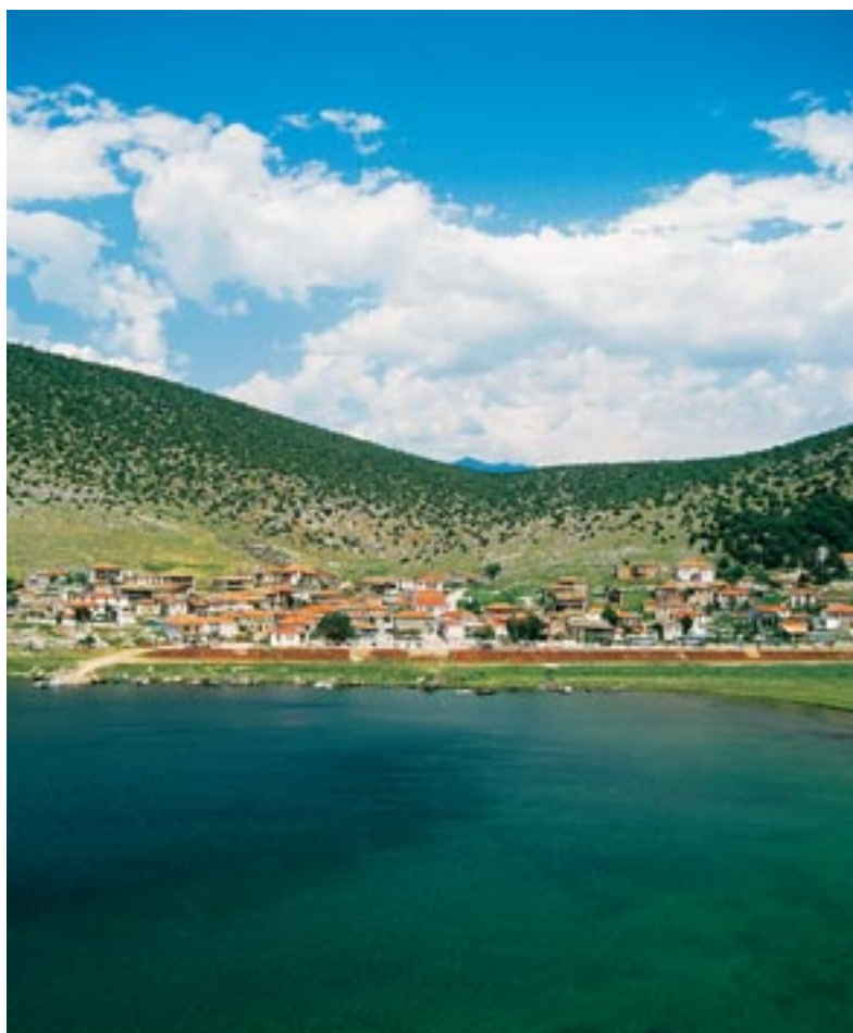
Ψαράδες, Πρέσπα, Φωτ. Αρχείο ΕΚΒΥ / Σ. Μηλιώνης