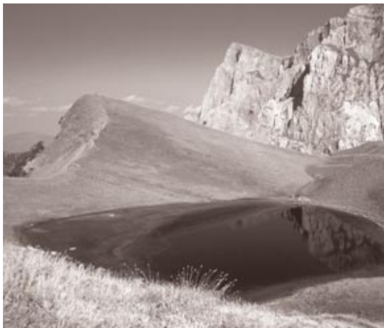
Δρακόλιμνη Τύμφης

Εκπόνηση εταιρικών σχεδίων δράσης προς όφελος της βιοποικιλότητας - Ενσωμάτωση των σχεδίων αυτών στο σύστημα